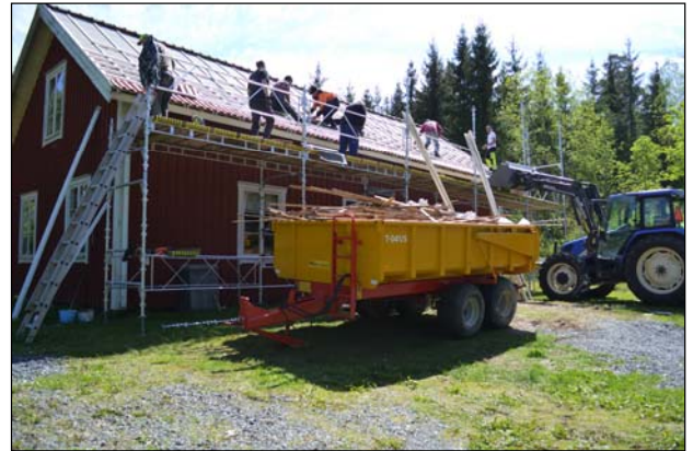
Även Nisses Lada behöver ses över