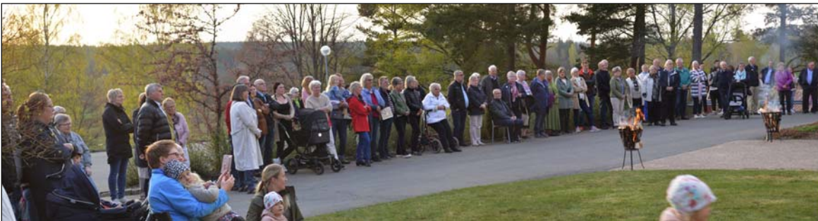
Valborg firades inför rekordpublik!